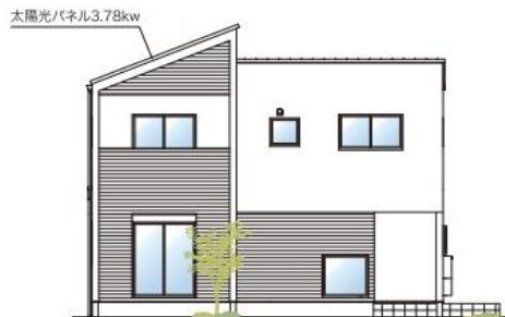
※建物並びに外観計画は予告なく変更する場合がございます。